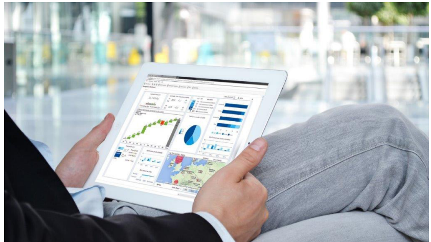
Abbildung 2: Problemloser lesender und schreibender Zugriff mit FibuNet webBI über mobile Endgeräte (iOS iPad, iOS iPhone, Android)

Mit dem FibuNet Reporting stehen vorentwickelte und aussagefähige Standardberichte sowie flexible Auswertungen bereit, die beliebig individualisiert werden können. Alle Daten aus der FibuNet-Finanzbuchhaltung, -Kostenrechnung und -Anlagenbuchhaltung sind hier problemlos im Zugriff und beliebig kombinierbar. Auch kleinere mittelständische Unternehmen verfügen mit FibuNet webBI ohne zusätzliche Ressourcen und mit minimalem Aufwand über ein aussagefähiges Reporting für Bilanzcontrolling, Finanzcontrolling sowie Kosten- und Erfolgscontrolling.